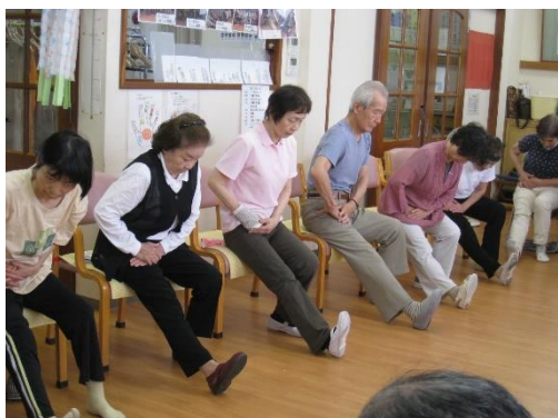
今度は下半身のストレッチへ