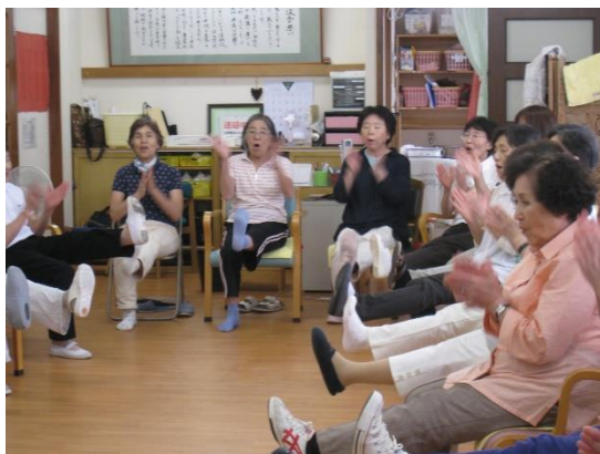
足だけではありません ポンぽんと大声だし、手を叩きます 口腔体操と手を叩く振動を組み合わせ